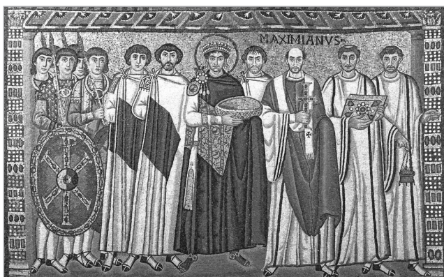
keiser Justinian i midten, mannen til venstre for ham er hærføreren Belisarius. To hoder til høyre står biskop Maximianus. Mosaikk i San Vitale, basilika fra 500-tallet i Ravenna.