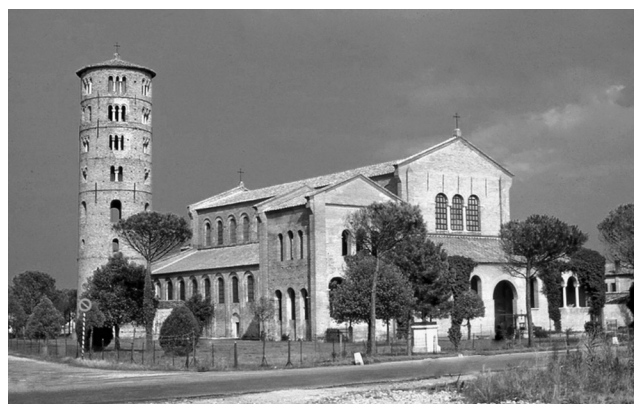
Keiser Justinian erobret Ravenna fra goterne i 540. For å markere seieren, lot han bygge to kirker i Ravenna, San Vitale og San Apollinare (vist på bildet) i Classe nær Ravenna.

heresien ble fordømt på det første konsil i Nikea i år 325, men den hadde mange tilhengere, særlig fordi arianerne som nevnt drev en utstrakt misjonsvirksomhet blant germanske folk.