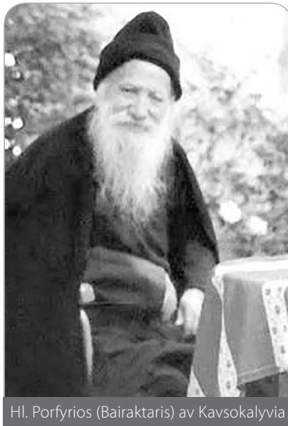
Hl. Porfyrios (Bairaktaris) av Kavsokalyvia

”Var det ikke det jeg sa til deg, gutten min?”, sa han. ”Hvorfor gjorde du det?”