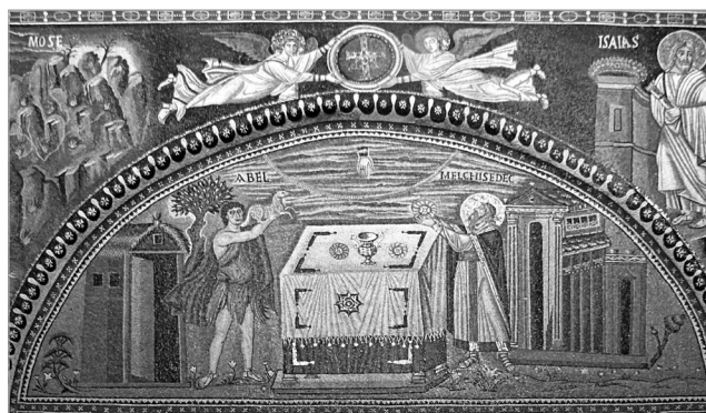
Abel og Melkisedek ved offeralteret. Mosaikk i San Vitale, basilika fra fra 500-tallet i Ravenna.

dager besøker disse bygningene, kan få en idé om Konstantinopels glans og prakt i denne perioden.