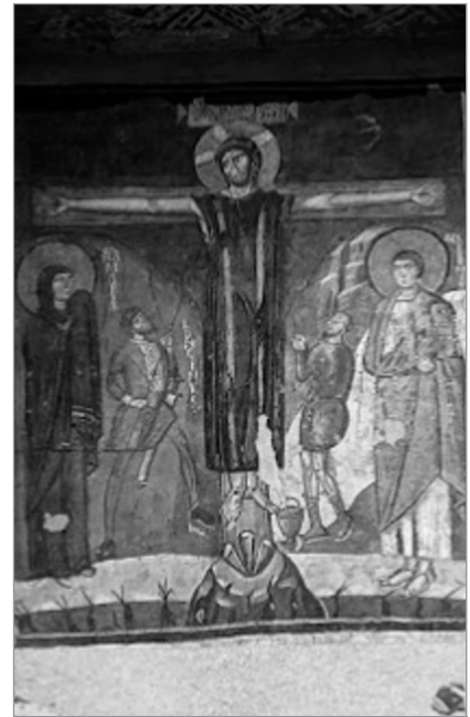
Korsfestelesesmotivet i Santa Maria Antiqua

av en høytstående funksjonær som hadde oppsyn med keiserpalasset på Palatinen. Han gikk så langt som til å overføre keiserhoffet til dette palasset, men etter hans død ble det tilbakeført til Lateranet. I løpet av sin korte periode som pave klarte Johannes VII å etterlate to bemerkelsesverdige monumenter. Det ene er freskeutsmykningen av kirken Santa Maria Antiqua ved Forum Romanum (kalt «middelalderens sextinske kapell»), og det andre er mosaikk-utsmykningen av et kapell i Peterskirken, hvor han ble begravet. Sistnevnte monument ble revet sammen med den gamle Peterskirken og er bare bevart i noen få fragmenter, men utsmykningen av Santa Maria Antiqua er forbausende godt bevart fordi denne kirken ble ødelagt av et jordskjelv i 847