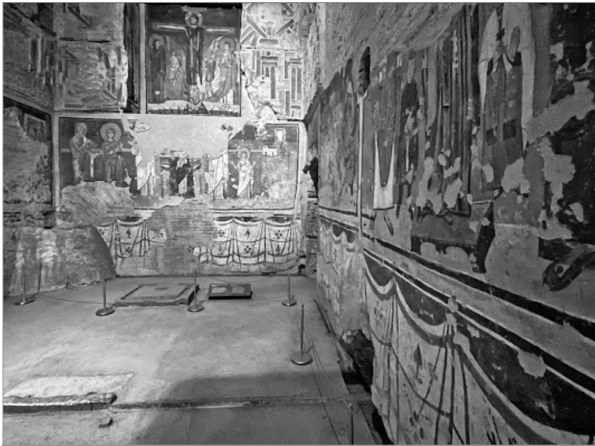
En del av kirkerommet i Santa Maria Antiqua