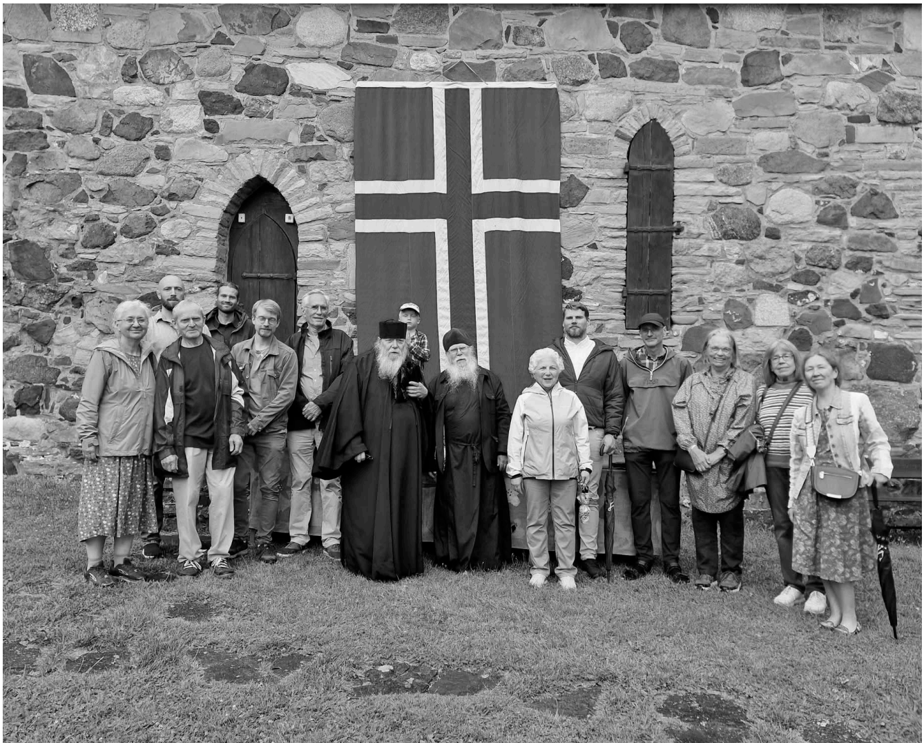
Vi feiret hl. Olav på Olsok 29. juli på Løvøya (i nærheten av Horten). Vi hadde en moleben utenfor Løvøy kapell som er fra middelalderen og har en kilde med historie tilbake til hl. Olav.