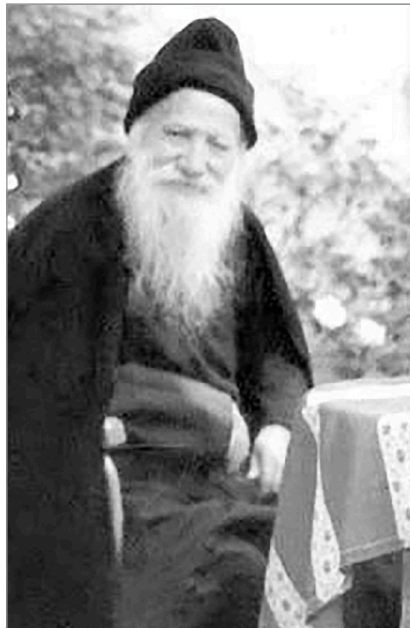
Hl. Porfyrios (Bairaktaris) av Kavsokalyvia

Så tok jeg med meg en skuldersekk og løp avgårde. Eller rette, jeg løp ikke til å begynne med, ikke så lenge mine eldre kunne se meg, men så snart jeg var ute av syne, begynte jeg å løpe. Jeg kløv opp noen steile stup hvor det ikke engang var villsvin akkurat nå, for når det har regnet, samler de seg for å spise snegler. Der sanket jeg snegler i tre timer. Jeg fant mange og fylte sekken. Jeg var drivende svett da jeg gikk nedover igjen. Det var kveld nå og luften ble kjølig og fuktig. En iskald vind blåste ned mot havet fra Athos-fjellet. Ryggen min var klissvåt av svette og