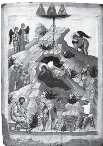
Ikonen för vår Frälsare Jesu Kristi födelse.

Glädje var hallstämpeln på den kristna komuniteten vid tiden för evangeliet, glädje och tacksamhet, glädje över detta att Gud så älskade världen att Han inte bara skapade den utan sände Sin Enfödde Son in i denna värld – inte för att döma den men för att frälsa den. Vi är frälsta, världen är frälst genom Guds kärlek; och vi måste göra denna frälsning till vår egen genom tacksamhet, som