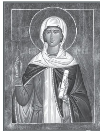
Hellige Nina Georgias Apostel

I løpet av århundrene spilte den georgiske kirken en avgjørende rolle i